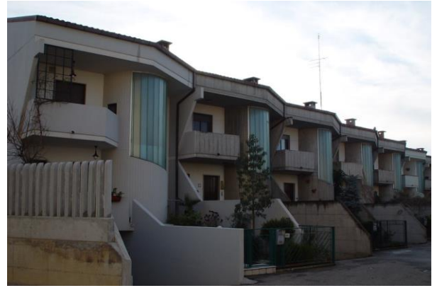
3) COMPLESSO via delle Camelie – 20 appartamenti (1992)