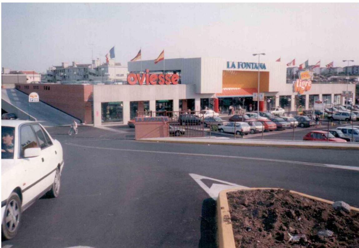
Questo documento non è di natura contrattuale, ma solo descrittiva ed illustrativa.

Il Centro Commerciale è regolarmente in funzione dal 12 luglio 1990 (data di inaugurazione).